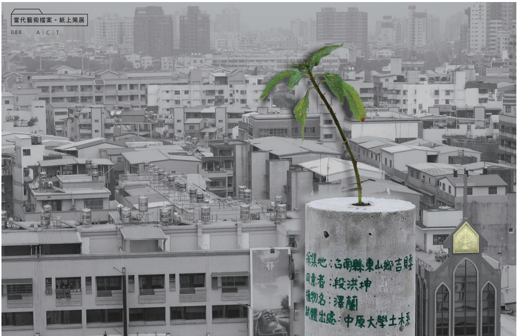
Cement Specimen+Ihing 水泥試體+澤蘭

Ihing, used in a ritual plant of the Siraya Tribe which is one of Taiwanese lowland indigenous people, background is Kaohsiung city. (Text and photo by Hsu, Su-chen)